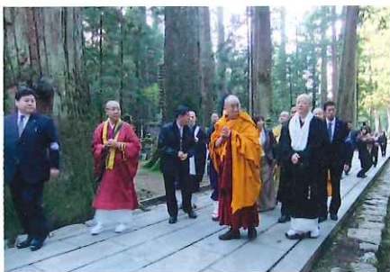
▲奥の院参拝風景 中央:ダライ・ラマ14世 その右:藤田学長